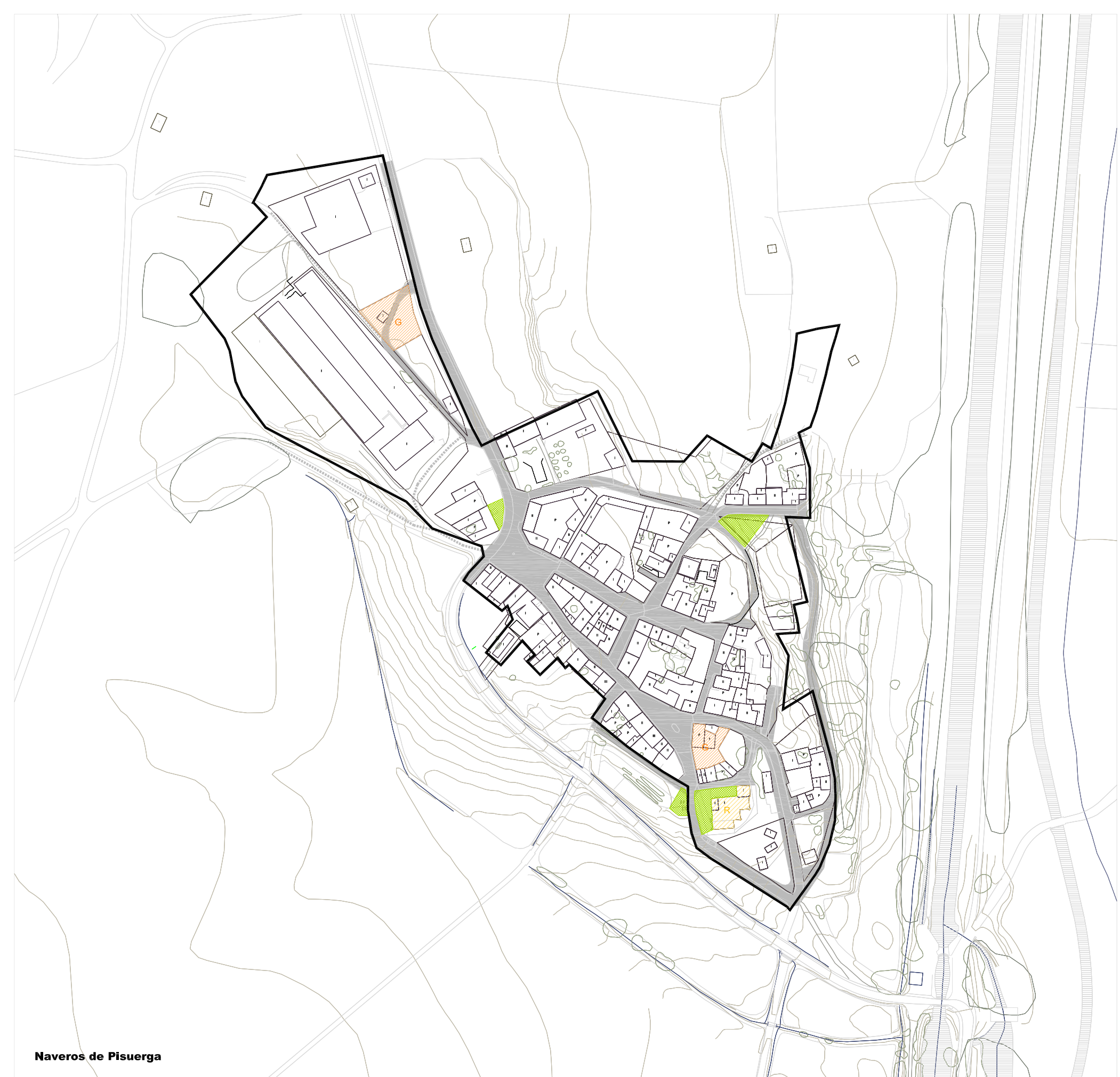
Naveros de Pisuerga