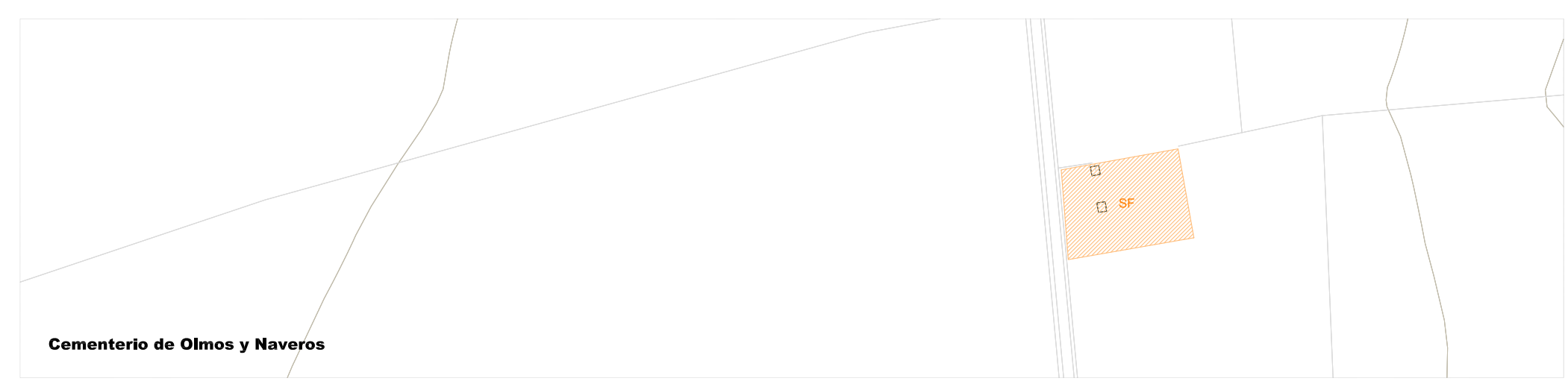
Cementerio de Olmos y Naveros