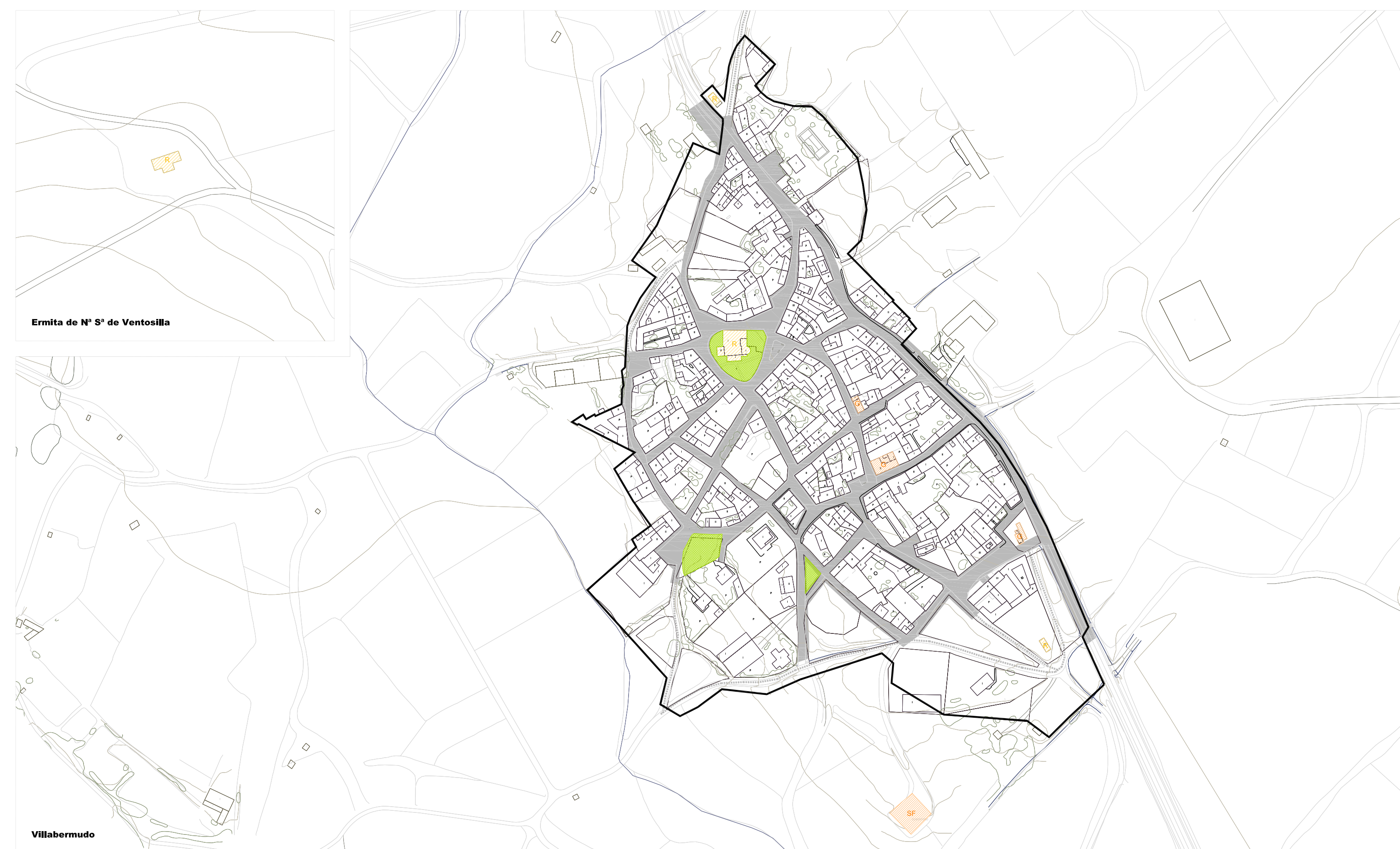
Ermita de N.ª de Ventosilla